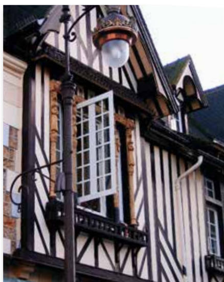
Printemps - Deauville

EXUBAIE MH : c'est l'alliance de l' esthétique extérieure et intérieure combinée au respect de l'architecture et des menuiseries existantes.