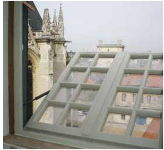
Château de Vincennes (parfaite intégration des dispositifs de désenfumage)