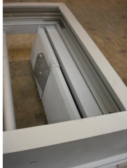
Appareil avec isolant

Etape 1 : préparer le cache bavette en appliquant un cordon de silicone à l'intérieur et sur toute la longueur