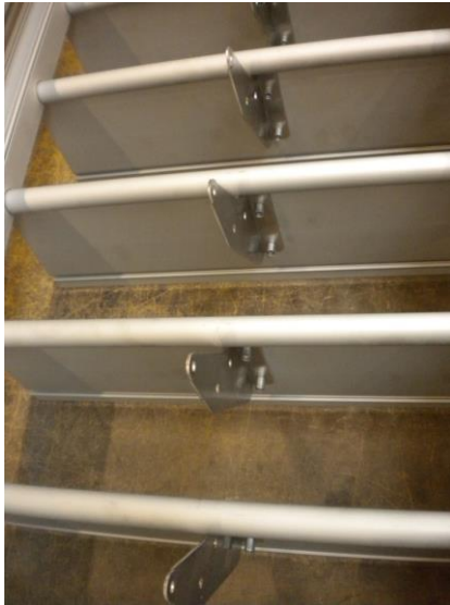
Appareil sans isolant