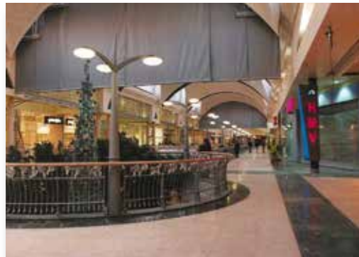
Centre commercial Xanadu - Madrid (Espagne)