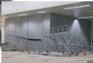
Airbus - Toulouse (31)