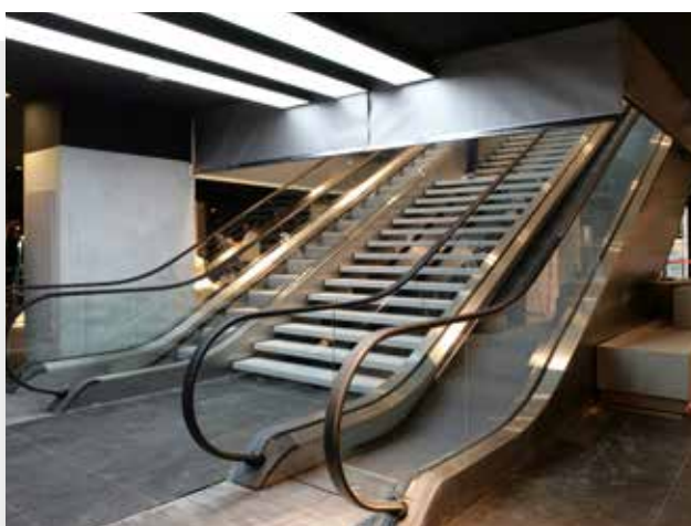
Adidas - Paris (75) - écran SMOKESTOP

Il représente une solution idéale pour les bâtiments de grandes dimensions .