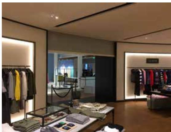
Le Bon Marché - Paris (75) - écran SMOKESTOP