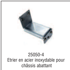
25050-4 Etrier en acier inoxydable pour châssis abattant