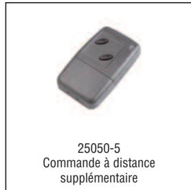
25050-5 Commande à distance supplémentaire