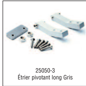
25050-3 Étrier pivotant long Gris