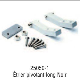
25050-1 Étrier pivotant long Noir