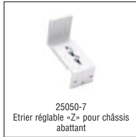
25050-7 Etrier réglable «Z» pour châssis abattant