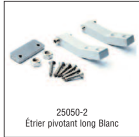
25050-2 Étrier pivotant long Blanc