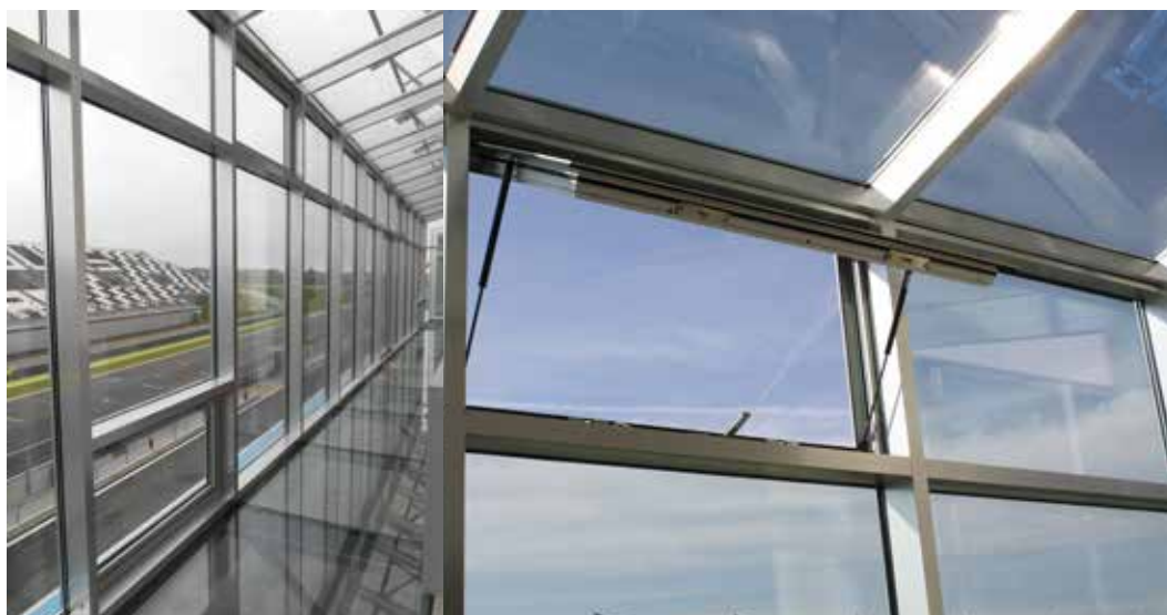
EXUBAIE V2 OS - Circuit F1 de Magny-Cours