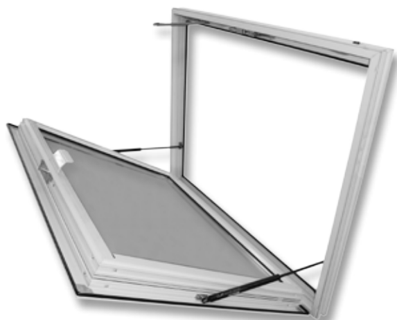
Exubaie V2 OS