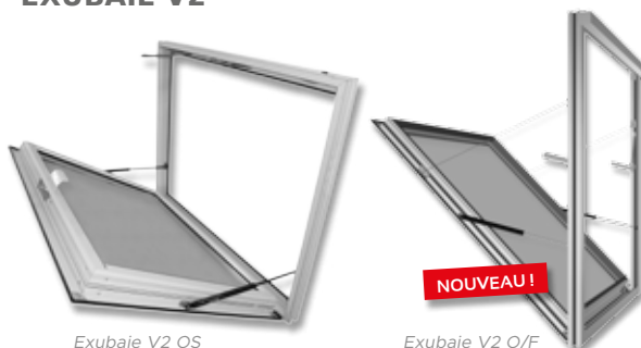
Exubaie V2 OS