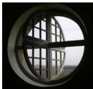
Château de Vincennes

La solution de désenfumage adaptée aux Monuments Historiques, respectant architecture et menuiseries existantes .