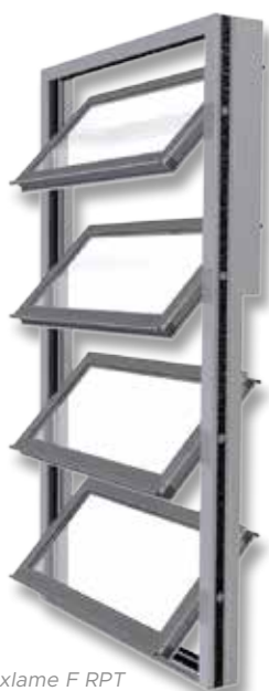
Luxlame F RPT

Conforme NF S 61937-8 selon configuration