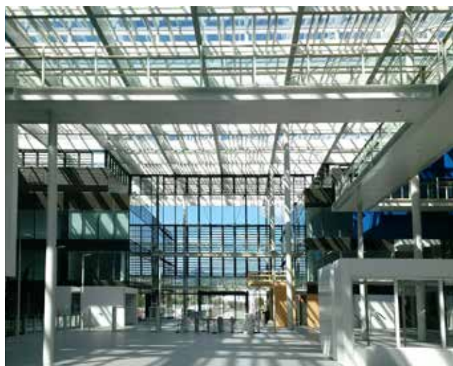
LUXLAME F RPT - Urbalad Michelin (Clermont-Ferrand) © Architectes Chaix & Morel et Associés