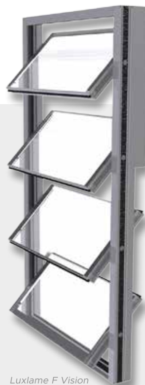
Luxlame F Vision

LUXLAME F se décline selon deux versions : LUXLAME F RPT (lames opaques ou vitrées) et LUXLAME F Vision , pour une meilleure esthétique des surfaces entièrement vitrées.