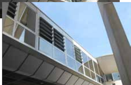
LUXLAME F RPT - Hôtel de Ville (Meyzieu) © Architecte X