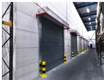
Rideau textile non irrigué résistant au feu FIRESCREEN