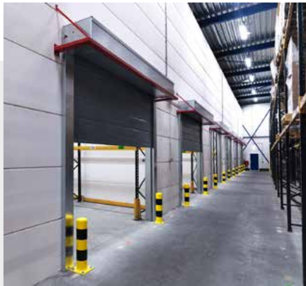
Rideau résistant au feu FIRESCREEN, ouvert

FIRESCREEN est conçu pour être déclenché lorsque le système central de détection incendie émet un signal d'alarme.