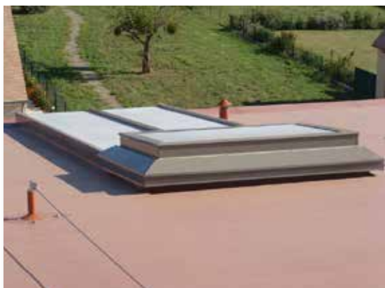
VENTIBAIE sur circulation EPAHD La Souvenance - Le Mans