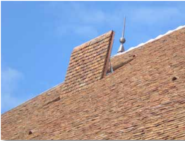
VENTIBAIE MH -Château de Chamerolles (Chilleurs aux Bois)