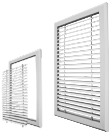
POSE EN APPLIQUE