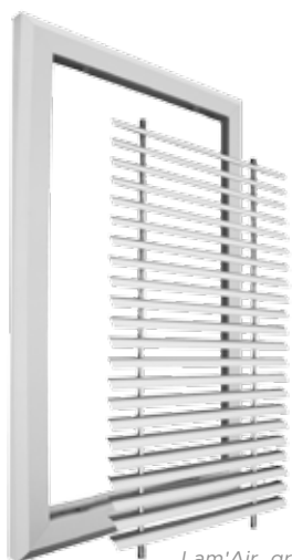
Lam'Air, grille démontable